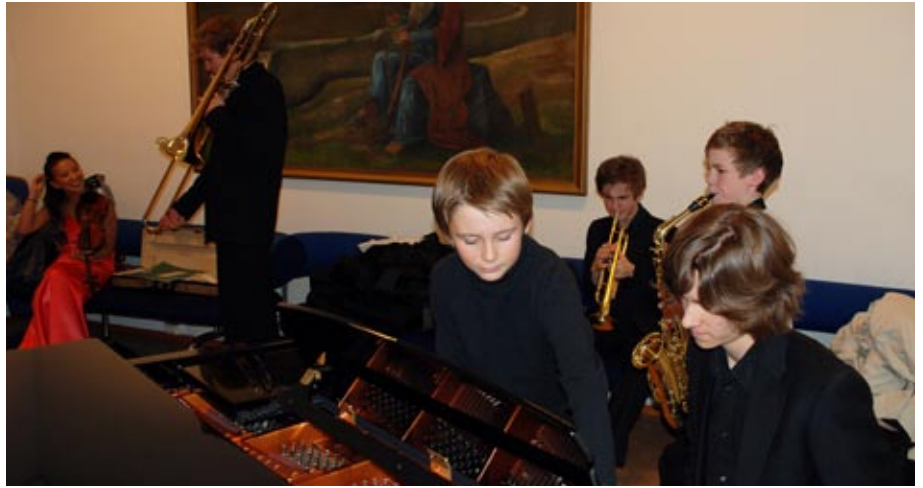
bak scenen: Prisvinnere øver før prisvinnerkonserten.