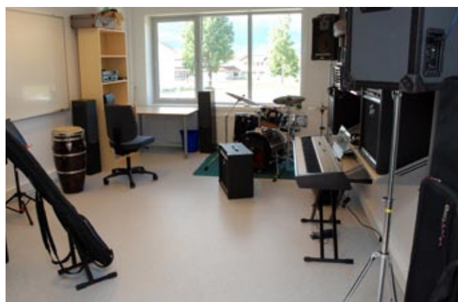
åtte rom: Kulturskulen har i alt åtte undervisningsrom i Trivselshagen.