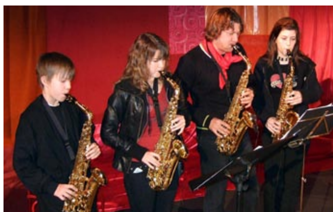
største faget: Musikkenevene utgjør suverent største elevgruppa også ved Karmøy kulturskole.