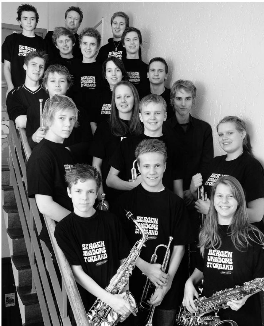
rift om plassene: Mange vil med i Bergen Ungdomsstorband.