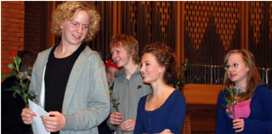
inspirasjonspris: Lerkekartetten sikret seg én av seks inspirasjonspriser.