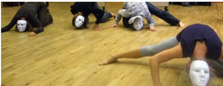
begeistring: Deltakarar på faggruppa teater laga ei maskeframsyning som skapte begeistring hos resten av forsamlinga.

tekst: margrethe henden aaraas