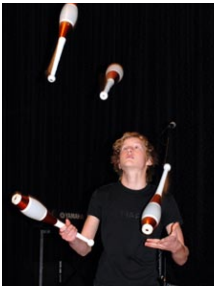
nysirkus: sjonglør fra Levanger.