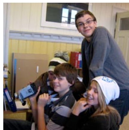
redigerer egen film: Unge filmskapere hygger seg med å lage videokunst.