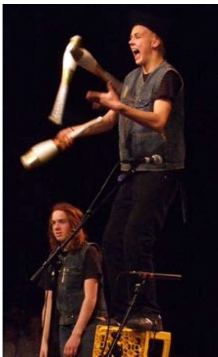
nytt og viktig: Faget nysirkus har muliggjort flere tverrfaglige satsinger.

Han sier at skolen gjennom de siste årene har arbeidet bevisst for å styrke det personalmessige. Fra 1998 - seks år før det ble nasjonal ordning - har kommunen lønnet lærere med kvalifikasjoner