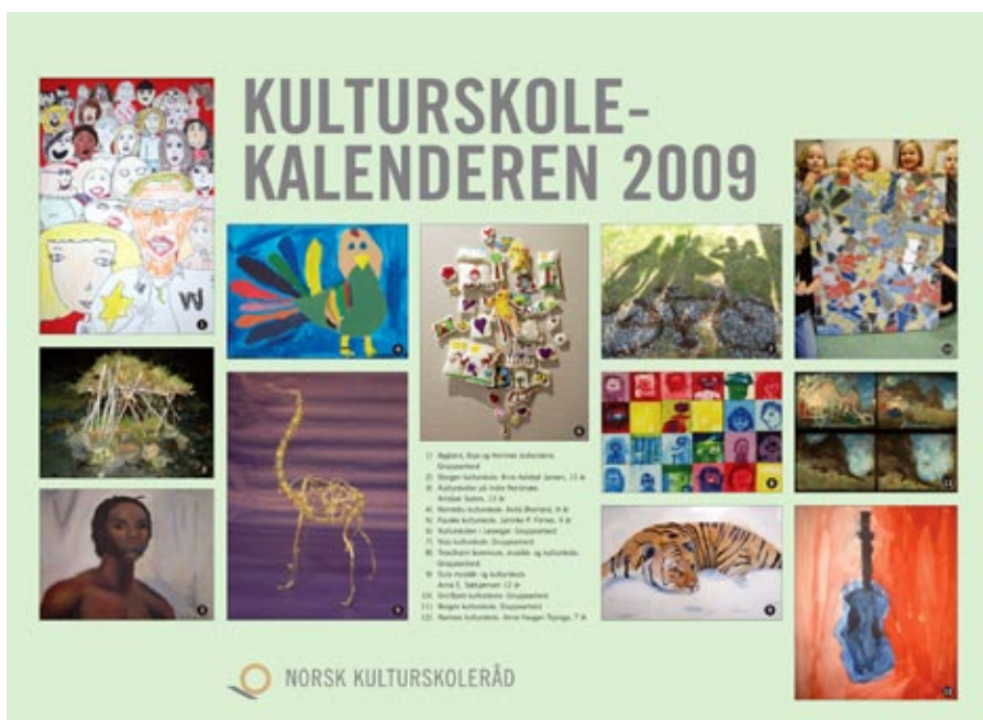
kalenderkunst: Kulturskolekalenderen 2009 er klar for bestilling.