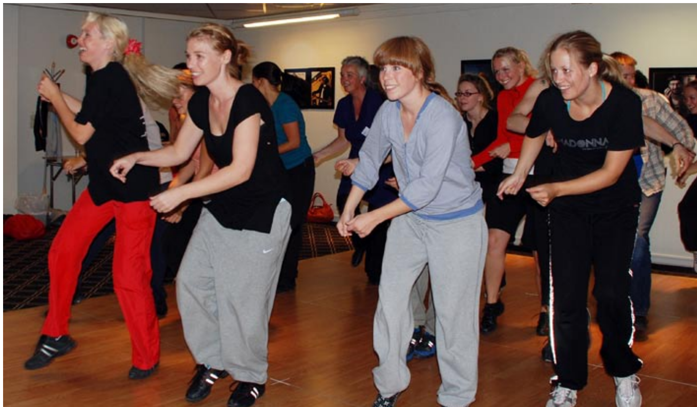
mer til kursing: Mer penger til utvikling av kulturskolene fører trolig blant annet til mer kursing av kulturskolepedagogene. Bildet er fra Kulturskolelagene 2008.