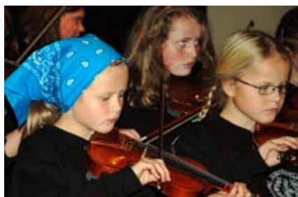
folkemusikk: unge "spellemenn" fra Verdal.