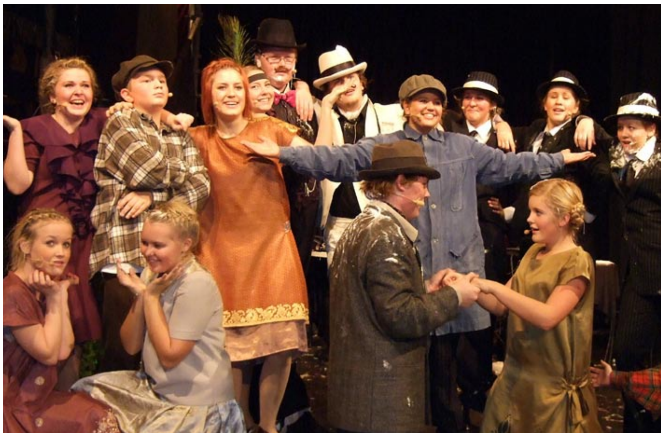
musikalsatsing: "Bugsy Malone" er nyeste produksjon hva gjelder musikalene ved Karmøy kulturskole.