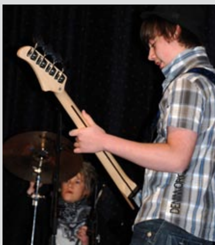
stipendmottakere i år: The BlackSheeps var blant mottakerne av Drømmestipendet i år. Hvem får Drømmestipendet 2009?

– Drømmestipendet er en fin anledning til å synliggjøre kulturskolen og alle kommunens dyktige kulturut-