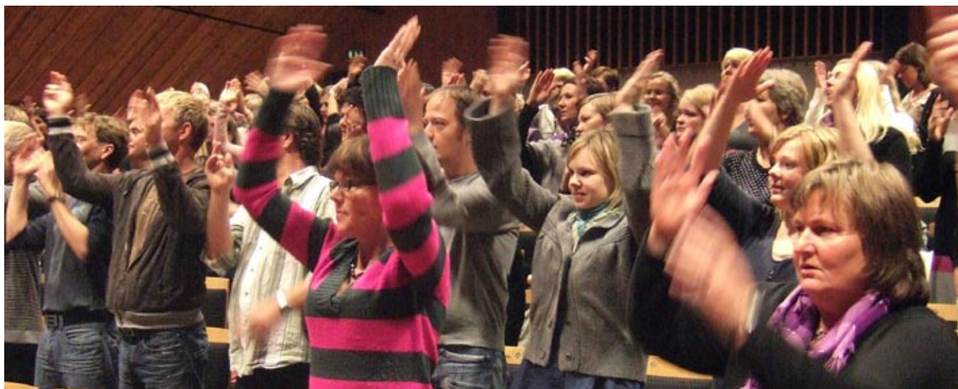
samstemt iver: stor samsangstemning i Søgne Gamle Prestegård hvor det var Kor Arti'-kurs 13. november.