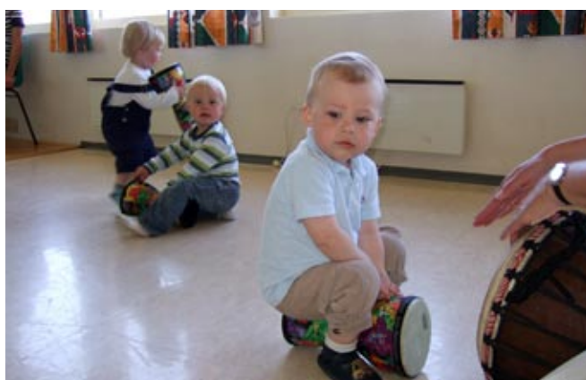
tidlig krøkes: Purunge karmøyværingene får også kravle på kulturskole.

tekst: egil hofsl