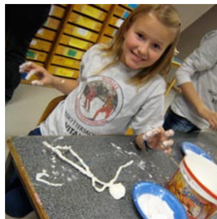
gips rundt streng: Mange artige figurer så dagens lys på Workshopfestivalen i Midt-Norge.