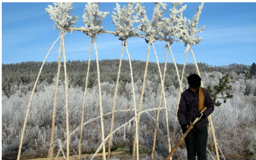
kunst på elvebredden: Finnmarkselvene- og lærerne skapte kunst i storformat ute i naturen.

Felles for alle verkstedkursene disse to dagene var at de foregikk ute i naturen. Naturens materialer og omgivelsene dannet utgangspunkt for de kunstverk som ble skapt i løpet av disse dagene.